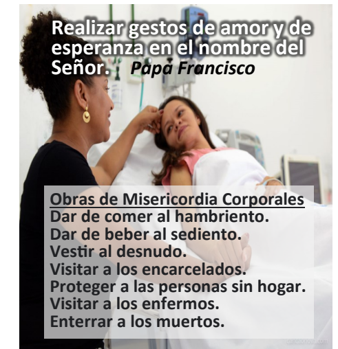
Realizar gestos de amor y de esperanza en el nombre del Señor. Papa Francisco

Y ahora recemos a María, que nos ayude a sentirnos amados y a transmitirnos cercanía y confianza.